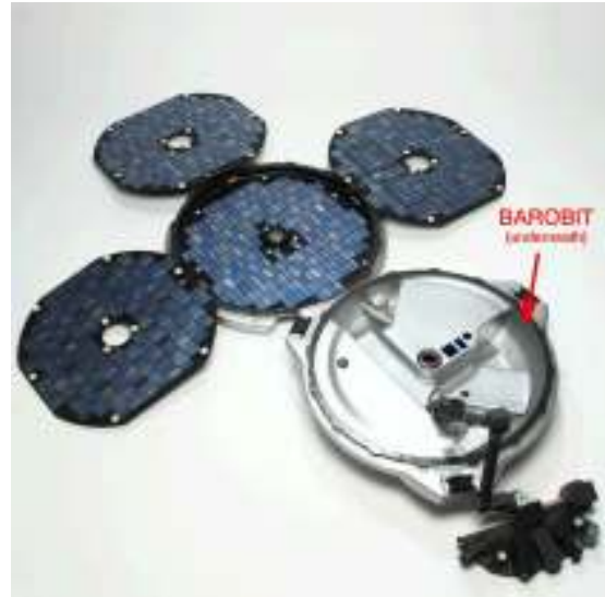
Barobit-paineanturin sijoitus Beagle 2 -laskeutujassa.

Barobitin mittausperiaatetta ja -teknologiaa on käytetty IL:n avaruushankkeissa vuodesta 1989 ja mittalaitteesta käytettyjä ja samankaltaisia antureita on seurattu testioloissa siitä lähtien. Vastaavaa teknologiaa tullaan käyttämään myös tulevaisuudessa Mars-hankkeissa, mm. MetNet-laskeutujissa sekä NASA:n Phoenix-luotaimessa.